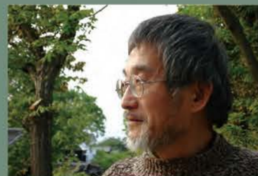
田島征三/1940年生まれ。絵本作家、美術家。代表作に「ちからたろう」など。