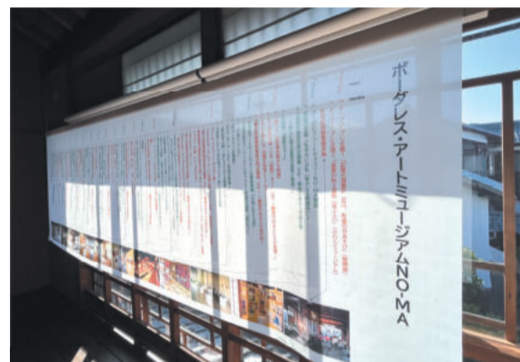
NO-MAの足跡を年表で展示した

彼らの制作過程を見聞きしているなかで、その集中とエネルギーには驚かされることばかりでした。「どうしてこんな作品ができるんだろう」が、当時の私には常に頭の中にはありました。障害の特性から生じるこだわり行動は、生活面では問題行動と扱われ、その行動を「改善」させるために施設等の