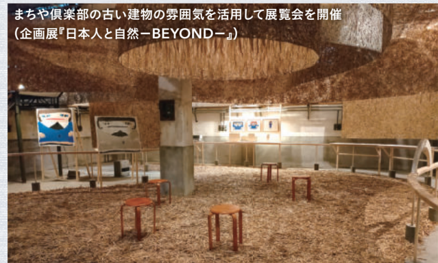
まちや倶楽部の古い建物の雰囲気を活用して展覧会を開催 (企画展『日本人と自然-BEYOND-』)