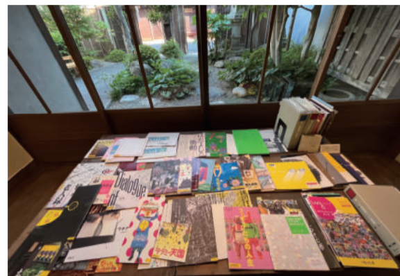
19年間に発行してきた図録の数々。試行錯誤の連続だった

NO-MAが開館した当時は、障害のある人たちの芸術文化活動はまだまだ限られた施設などで行われておらず、ましてや展覧会となると地域差はあるものの皆無に近い状況でした。たとえ、そのような催しを実施したとしても、スーパーや銀行などの催事場や待合室、公民館などが会場となり、展示とは程遠い「陳列」といった雰囲気のものでした。施設での活動を中心として生み出された彼らの作品は、観るものに対して、大小何らかの衝動を伝えてくれていたのは間違いなく、買い物や用事の一つではなく、ゆっくりとその作品群と対峙できる空間がほしいというのが我々の想いでした。そして、