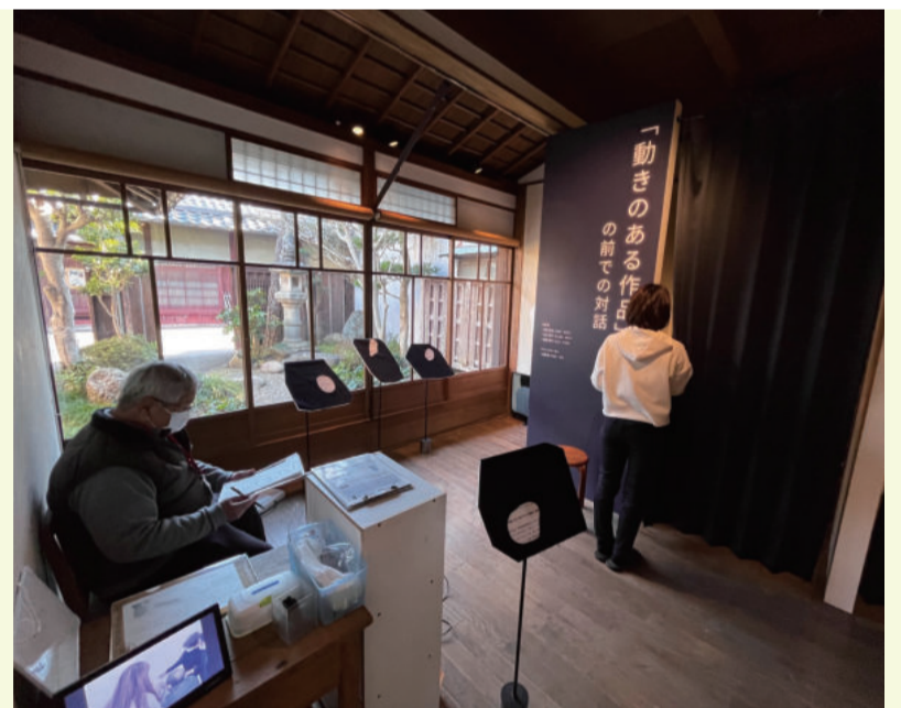
会場ボランティアの皆さんのご案内で鑑賞していただきました

る面白さがあると思った」「『霞』や『雲』などのイメージが盲ろう者の世界の中で細かにあることを感じて驚きました」など、盲ろう者が捉える世界というものに驚き、感覚をシェアしあうことに共感する声が聞かれました。