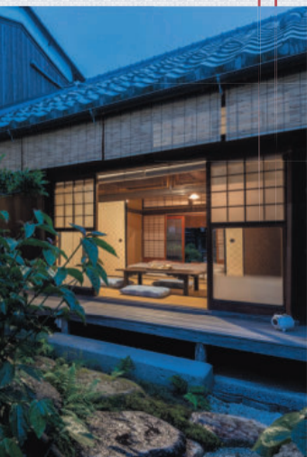
まちや倶楽部の宿泊部屋は、日本家屋の落ち着いた雰囲気そのまま残している